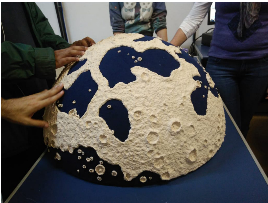
Teste realizado com técnico com deficiência visual na Lua tátil

em gomos e a lista de material utilizado, além de descrição detalhada para texturizar uma Lua em 3D.