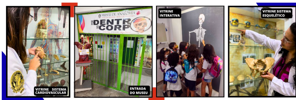
Figura 1: Entrada do Museu de Anatomia e suas vitrines temáticas

O Museu de Anatomia “Por Dentro do Corpo” (Figura 1), inaugurado em 2017, localiza-se no Laboratório Anatômico do prédio do Centro de Ciências da Saúde no Campus Ilha do Fundão da Universidade Federal do Rio de Janeiro (UFRJ). Além de receber visitas escolares, o museu proporciona treinamento aos alunos de graduação da UFRJ na recepção do público, mediação das visitas e na elaboração de recursos didáticos para o ensino de Anatomia Humana.