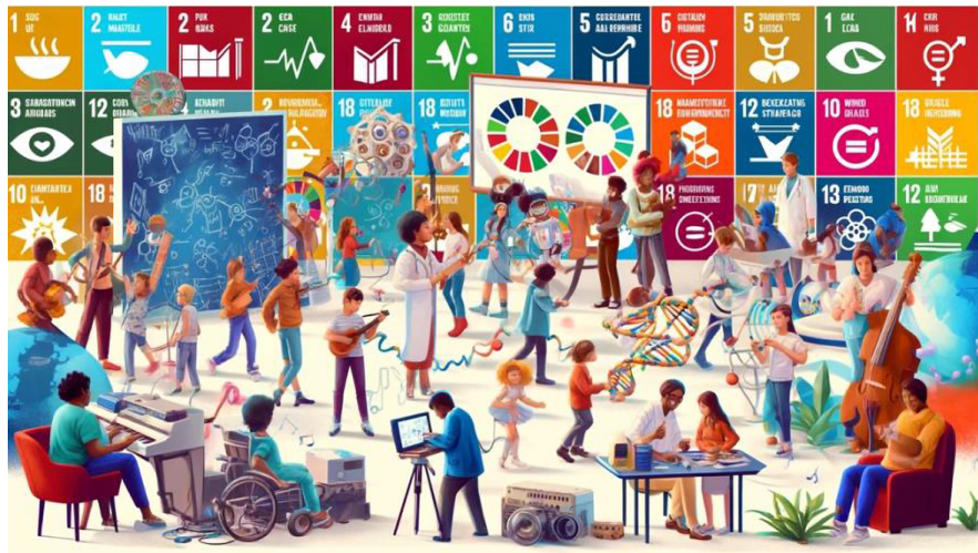
Figura 5: Cenário sobre a perspectiva futura do Scientificarte.