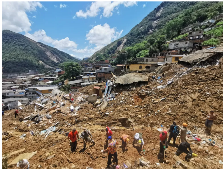
Registro do deslizamento no Morro da Oficina, em Petrópolis, Região Serrana do Rio de Janeiro, em fevereiro de 2022

alguma forma de participação que contribua para uma gestão de riscos mais eficiente e justa.