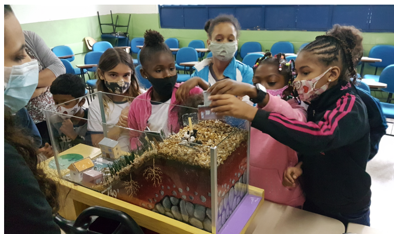
Experimentos complementam as exposições teóricas e promovem a participação dos estudantes

Os princípios que vêm norteando as atividades realizadas pelo projeto são baseados na literatura científica 7,8,9,10 e nas próprias experiências realizadas, destacando-se: incorporação das oficinas em diferentes estruturas educacionais (formais e não formais); realização de atividades baseadas não somente em exposições teóricas, mas também em observações e experimentos; realização de atividades interativas e participativas com o público; conexão com a realidade da comunidade local, principalmente a exposta às ameaças de deslizamentos; consideração prévia da percepção de risco do público; relação dialógica entre os diferentes participantes das atividades visando a possibilitar a construção de novos saberes; geração de “pensamento crítico em relação à realidade, favorecendo a construção da capacidade pessoal e social e possibilitando a transformação de relações sociais de poder”. 7 As atividades utilizam diferentes dinâmicas e instrumentos, como maquetes, vídeos, jogos, fotos e outros objetos.