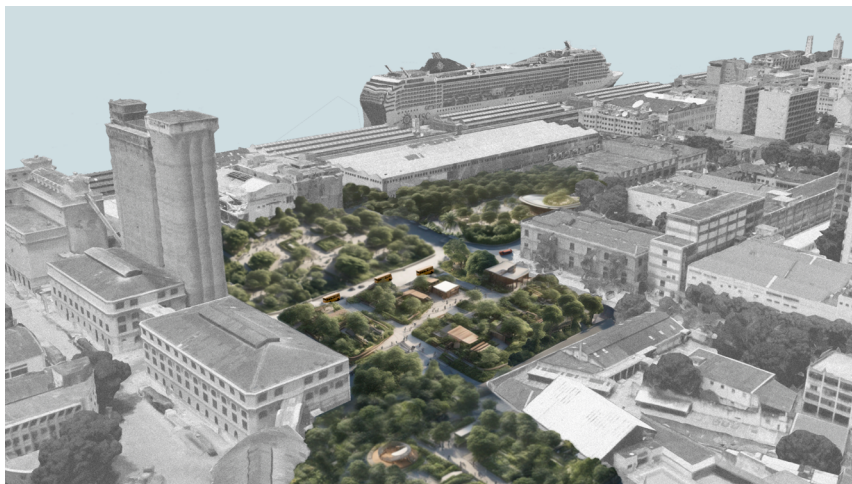
Ponto de Floresta, imaginário urbano de futuro desenvolvido pelo Floresta Cidade em parceria com diversos parceiros da Região Portuária ao longo de 2022 e 2023. Atualmente está sendo desenvolvido como um projeto de adaptação ecológica para a cidade do Rio de Janeiro diante das crises climáticas.

Esse é apenas um exemplo de como outros modos de ser e viver podem nos ajudar a desnaturalizar hábitos como o excesso de pavimentação das cidades. Com esse costume de pavimentar sempre que possível, inclusive, estaríamos sufocando a terra, impedindo-a de respirar, nas palavras do pensador Sergio Yanomami. 9 É chegada a hora de construir menos ou, com os resíduos da construção civil, de pensar espaços vivos com a própria floresta ou com soluções baseadas na natureza, de apostar mais na imaterialidade dos espaços ou, até mesmo, de desconstruir, como afirmou Wellington Cançado. 10 É hora de praticar todas as ações possíveis capazes de reduzir o nosso consumo excessivo, visto que o mercado da construção leva com ele metade dos recursos do planeta, sem contar a poluição que promove. Urgem esforços de imaginação de diferentes formas de cidades. Todavia, seriam as lajes que nos separam do chão outras caixas de concreto capazes de limitar nossas percepções e conexões com os demais seres da Mata Atlântica?