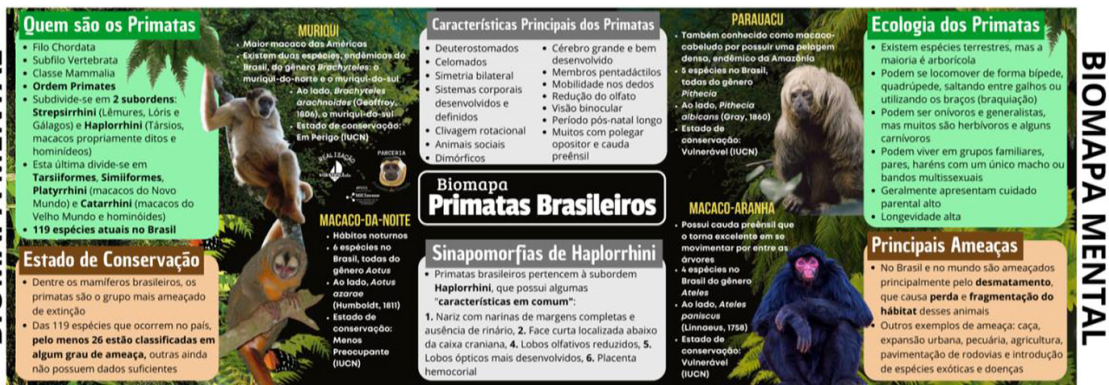
Figura 3: Exemplo de Mapa Mental do Scientificarte.

Em relação às atividades presenciais, o projeto Scientificarte realizou mais de 30 oficinas interativas interdisciplinares para o ensino básico, focadas nas áreas de Ciência e Arte. Desde a sua criação, o Scientificarte já recebeu mais de 30 mil participantes em suas oficinas, provenientes de diversos municípios do Rio de Janeiro, além de instituições, espaços abertos e eventos regionais, nacionais e internacionais. Dentre as oficinas, destacam-se: “O Reino das Águas Claras e Escuras”; “Jogando Xadrez com o Scientificarte”; “Desenhando a Água com Monet”; “Viagem Submarina”; “Agroartizando com Arcimboldo”; e “Bioarte no Mangue”. Cada oficina utilizou diferentes elementos artísticos, como literatura, cinema, música e pintura, para enriquecer a experiência educativa e estimular o interesse dos participantes (Silva & Oliveira, 2022). Atualmente, as oficinas também são realizadas no laboratório TaxoN, localizado no campus UFRJ Ilha do Fundão, onde o público tem a oportunidade de interagir com pesquisadores e vivenciar práticas em um ambiente de pesquisa.