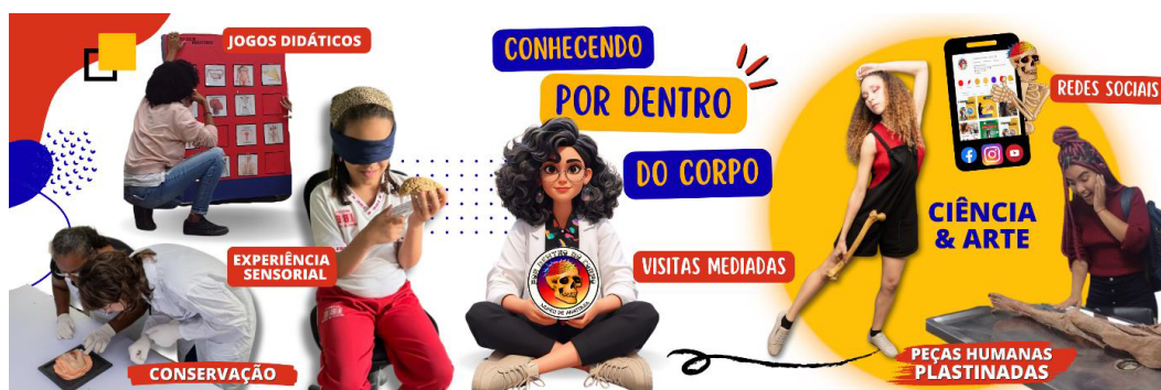
Figura 3: Atividades realizadas no Museu de Anatomia “Por dentro do Corpo”

No Museu de Anatomia “Por Dentro do Corpo” também há jogos didáticos como quebra-cabeças, jogos da memória, visualização de imagens especiais com óculos 3D e quiz de perguntas. Nas dinâmicas “Onde está o Cláudio?” o visitante deve procurar as logomarcas temáticas, que estão escondidas nas vitrines, e no “Desafio Orgânica”, o público é estimulado a identificar as estruturas anatômicas humanas em algumas fotografias representadas de forma artística junto com elementos da flora da Ilha do Fundão.