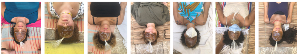
Oficina sensorial Habitar Água ministrada como parte do processo participativo de concepção da reforma do espaço da Casa Resistências realizado pelo Floresta Cidade (Floresta Maré). A Casa Resistências é o primeiro abrigo latino-americano para mulheres lésbicas de favela em situação de violência liderado pela Coletiva Resistência Lésbica da Maré, localizada na Vila do Pinheiro no Complexo de favelas da Maré no Rio de Janeiro. Reforma realizada na primeira metade de 2022.

Há um convívio de habitação entre nós, de enfrentamento de lutas e problemas, de rede de apoio, de invenção de mundo, de aliança parental, de promoção de alegrias e sentidos existenciais. Nas nossas atividades desenvolvemos uma atenção ao outro, o que cria laços afetivos que tanto sustentam o próprio coletivo quanto são a principal habilidade dos nossos corpos ao encontrarmos os territórios nos quais trabalhamos. Trata-se de um modo de habitar, de um corpo poroso e sensível ao encontro com o outro, humano ou não, tal qual a floresta. Antes de propor ao Rio de Janeiro, procuramos praticar, ser floresta cidade.