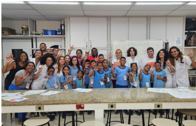
Foto 1: Equipe de monitores do projeto, professores e alunos surdos de São João de Meriti no curso com tema “células”.

Na pós-graduação, a quantidade de surdos estudantes é ainda menor. Suas pesquisas tendem a se concentrar na valorização da língua e cultura surdas. 6 No campo das ciências tecnológicas, biológicas e da saúde, a grande dificuldade de acessibilidade, bem como questões financeiras e psicológicas de permanência, torna o número de surdos com o título de doutor praticamente inexistente. 7