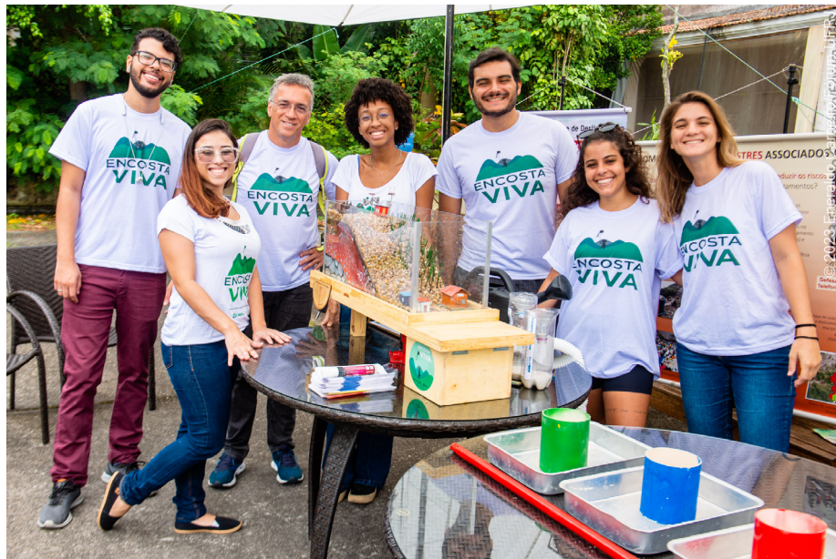
Equipe do projeto durante a realização de oficinas na Casa da Ciência da UFRJ, em 2023

De uma forma geral, as oficinas abordam os seguintes tópicos: conceitos de deslizamentos e de desastres; condicionantes naturais e antrópicos dos deslizamentos; construção social dos riscos; possíveis impactos na comunidade; ações de RRD; sistema de alarme para a evacuação emergencial; formas como os moradores podem contribuir para a redução dos riscos.