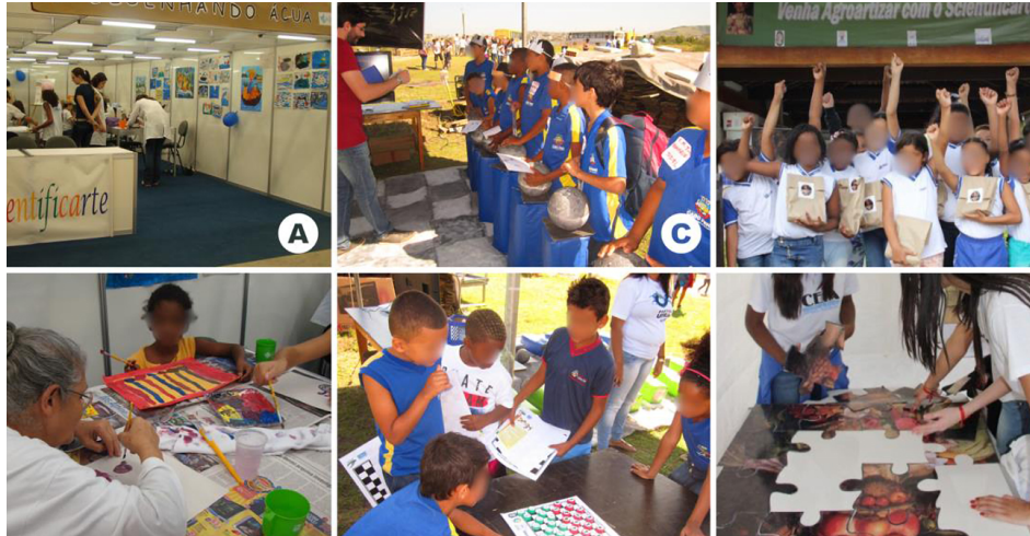
Figura 4: Oficinas do Scientificarte. (A e B) Desenhando a Água com Monet, (C e D) Jogando Xadrez e (E e F) Agroartizando com Arcimboldo.

Também são resultados notáveis do projeto Scientificarte os estudantes que participaram do programa e que hoje atuam no ensino, pesquisa e diversos campos profissionais. O projeto já acolheu mais de 30 alunos estagiários e foi reconhecido com diversos prêmios por suas contribuições à educação e divulgação científica. Além disso, o Scientificarte publicou vários artigos na revista Ciência Hoje das Crianças , onde é possível consultar mais sobre o trabalho desenvolvido pelo projeto: