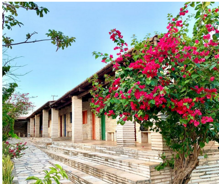
Figura 3: Panorama externo das acomodações da Casa da Pedra, polo educacional da Universidade Federal do Rio de Janeiro, Instituto de Geociências

A memória da Pedra Cariri preservada entre as paredes da Casa da Pedra é prova da obstinação dos habitantes da Bacia do Araripe que há séculos utilizam o calcário para construção de casas, igrejas, sepulturas e objetos do cotidiano. Isso permite o resgate e o registro do passado geológico da região e promove os ideais de geoconservação e geodiversidade, fundamentais para a manutenção da história da Terra. A Casa da Pedra, desde sua construção, tem se tornado muito mais do que um polo educacional, ela vem se transformando em um espaço de respeito e valorização da história do povo que ali habita e da identidade territorial daquele lugar.