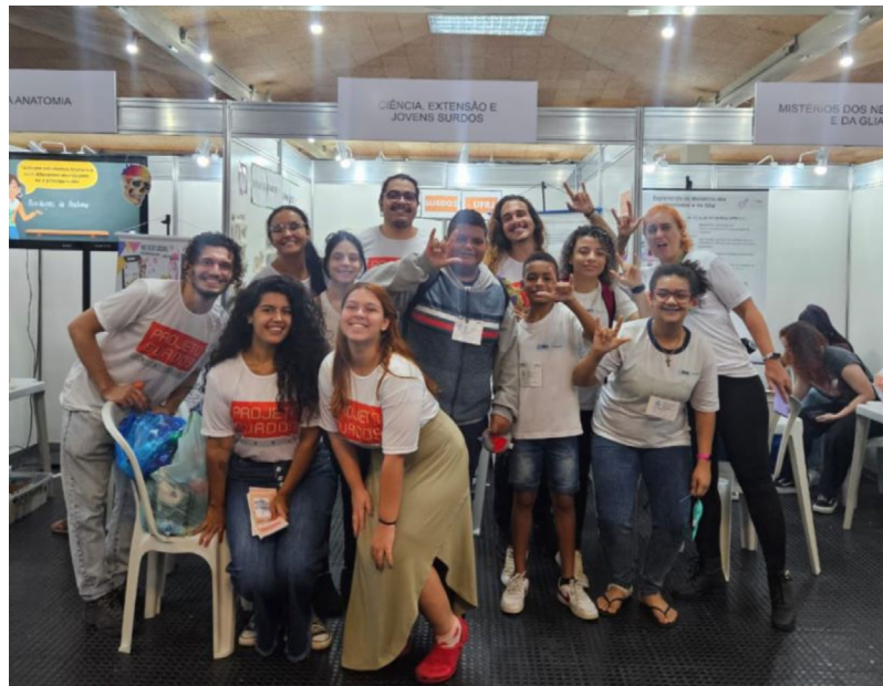
Foto 2: Equipe de monitores surdos e ouvintes ao lado de alunos surdos visitantes na Semana Nacional de Ciência e Tecnologia de 2023 (Fonte: acervo do projeto).

Atualmente, o laboratório conta com dois surdos monitores e cinco estudantes extensionistas do curso de Enfermagem/UFRJ, e está prestes a receber um novo monitor surdo sinalizante graduando de Ciências Biológicas.