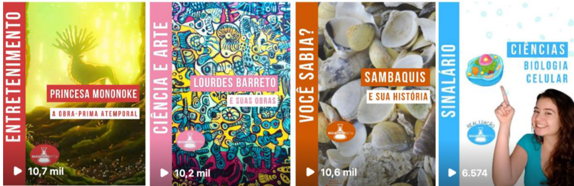
Figura 2: Categorias do Instagram do Scientificarte.

estão acessíveis gratuitamente através do linktree do Instagram do projeto ( https://linktr.ee/scientificarte ). Além disso, destaca-se a produção de reels em Libras, onde se ensina de três a cinco em Libras. Essas publicações semanais alcançam milhares de visualizações, ampliando o alcance e a acessibilidade do conteúdo educacional.