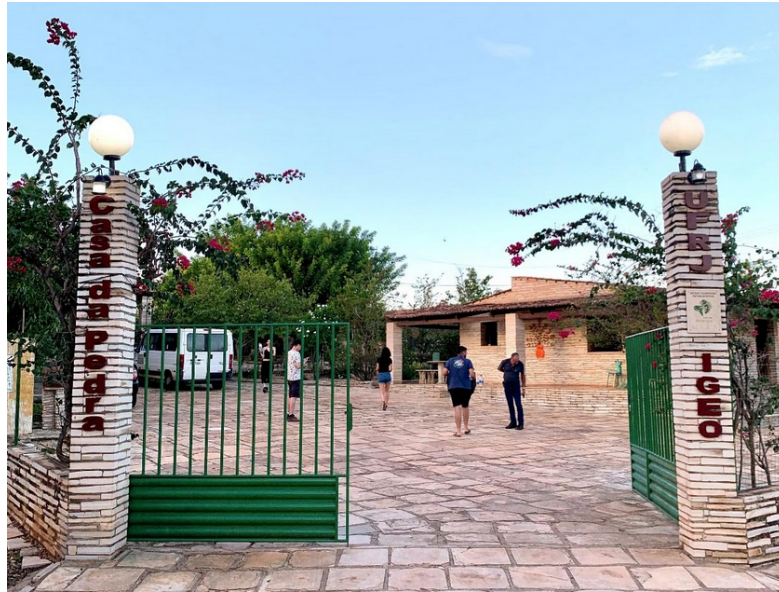
Figura 1: Dependências do polo Casa da Pedra são compostas por 13 quartos, sala de aula, área comum, cozinha e jardim