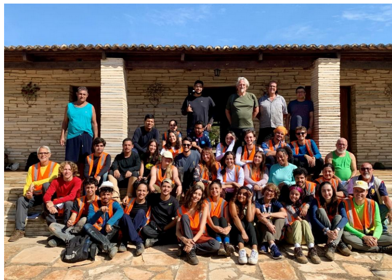
Figura 2: Integrantes da excursão da atividade de campo da turma da disciplina de Paleontologia, do curso de Geologia da UFRJ. Atividade realizada em fevereiro de 2024.

Anualmente, duas disciplinas ministradas nos cursos de graduação em Geologia e Geografia da UFRJ, Paleontologia e Paleogeografia, respectivamente, utilizam a Casa da Pedra. Nelas, cerca de 100 estudantes desbravam e compreendem um pouco mais sobre geologia, paleontologia e paleogeografia da região a cada ano, com um enfoque maior à mais extensa das bacias interiores do Nordeste do Brasil, a Bacia do Araripe. A criação da unidade foi fundamental para o suporte de atividades de pesquisa do Instituto de Geociências que ocorrem desde 1969 na região e em regiões adjacentes.º