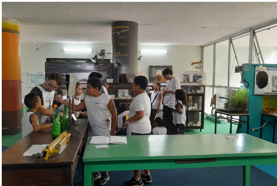
Figura 1: Alunos do ensino básico visitam a exposição com mediação de graduandos da UFRJ

das atividades de pesquisa de uma universidade pública. O projeto também participa de eventos de extensão na UFRJ e em escolas públicas (Tabela 1).