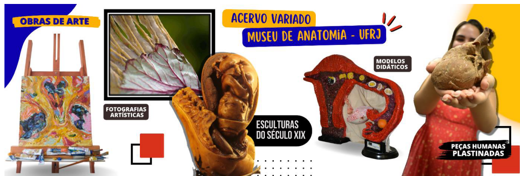
Figura 2: Variedade do acervo do Museu de Anatomia

fotografias artísticas, pinturas, modelos didáticos e esculturas em cera (ceroplastia) do século XIX.