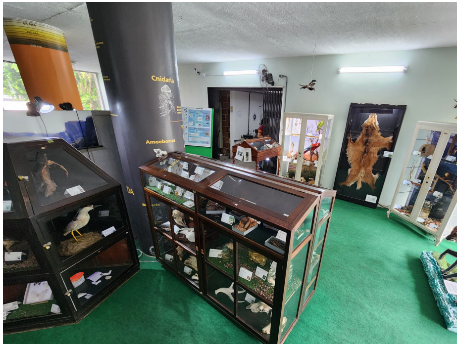
Figura 2: exposição apresenta diversas espécies do bioma cerrado ao público

A Exposição está em constante revitalização e ampliação. Em 2022, foi inaugurada uma vértebra de baleia jubarte ( Megaptera novaeangliae ). No ano seguinte, foi inaugurado o Espaço Bertha Lutz, em homenagem ao Dia Internacional da Mulher e o espaço “Cerrado”, ilustrado por exsicatas de espécies vegetais típicas como a lobeira ( Solanum lycocarpum ), cujo fruto é consumido pelo lobo-guará, aves taxidermizadas e uma pele de lobo-guará ( Chrysocyon brachyurus ), dentre outras espécies deste bioma (Figura 2).